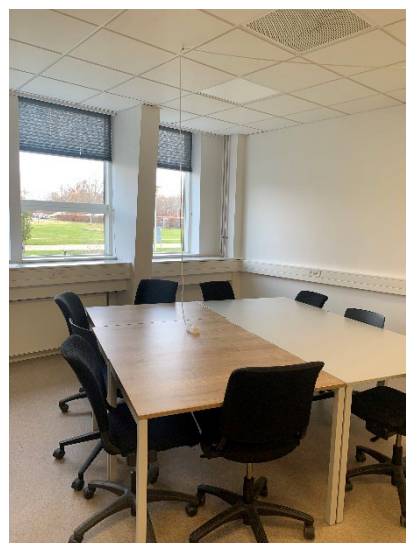
Stikdåsen hænger i en krog ned fra loftet, så de studerende ikke risikerer at falde over ledningen.

I undervisningslokalerne hænger der stikdåser ned fra loftet, så de studerende ikke falder over ledningerne. Det er en problematik som studerende på flere af Cphbusiness' øvrige campusser har påtalt. Løsningen på Laboratorie og Miljø kan derfor eventuelt bruges som inspiration.